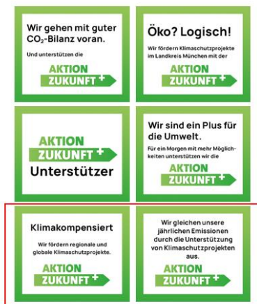
Online-Banner für die Homepage oder Email-Signaturen