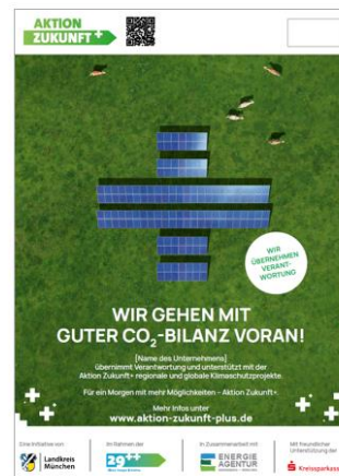
Poster mit Firmenlogo

Kontaktieren Sie uns hierzu gerne direkt unter unternehmen@aktion-zukunft-plus.de .